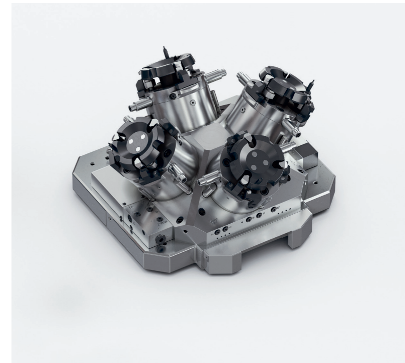
Ejemplo de sujeciones múltiples

Nuestros asesores técnicos proporcionan recomendaciones específicas para la aplicación para optimizar sus pasos de fabricación. De esta manera, conseguirá aumentar sus tiempos principales y reducir al mínimo los tiempos auxiliares improductivos.