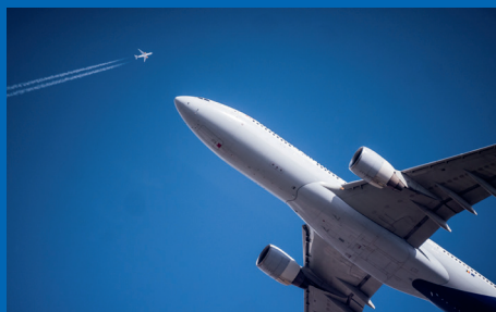
AERONÁUTICA Y AEROESPACIAL